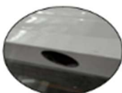
REGISTRO CIRCULAR EXTRA PLANO